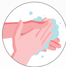
Mencuci tangan pakai sabun